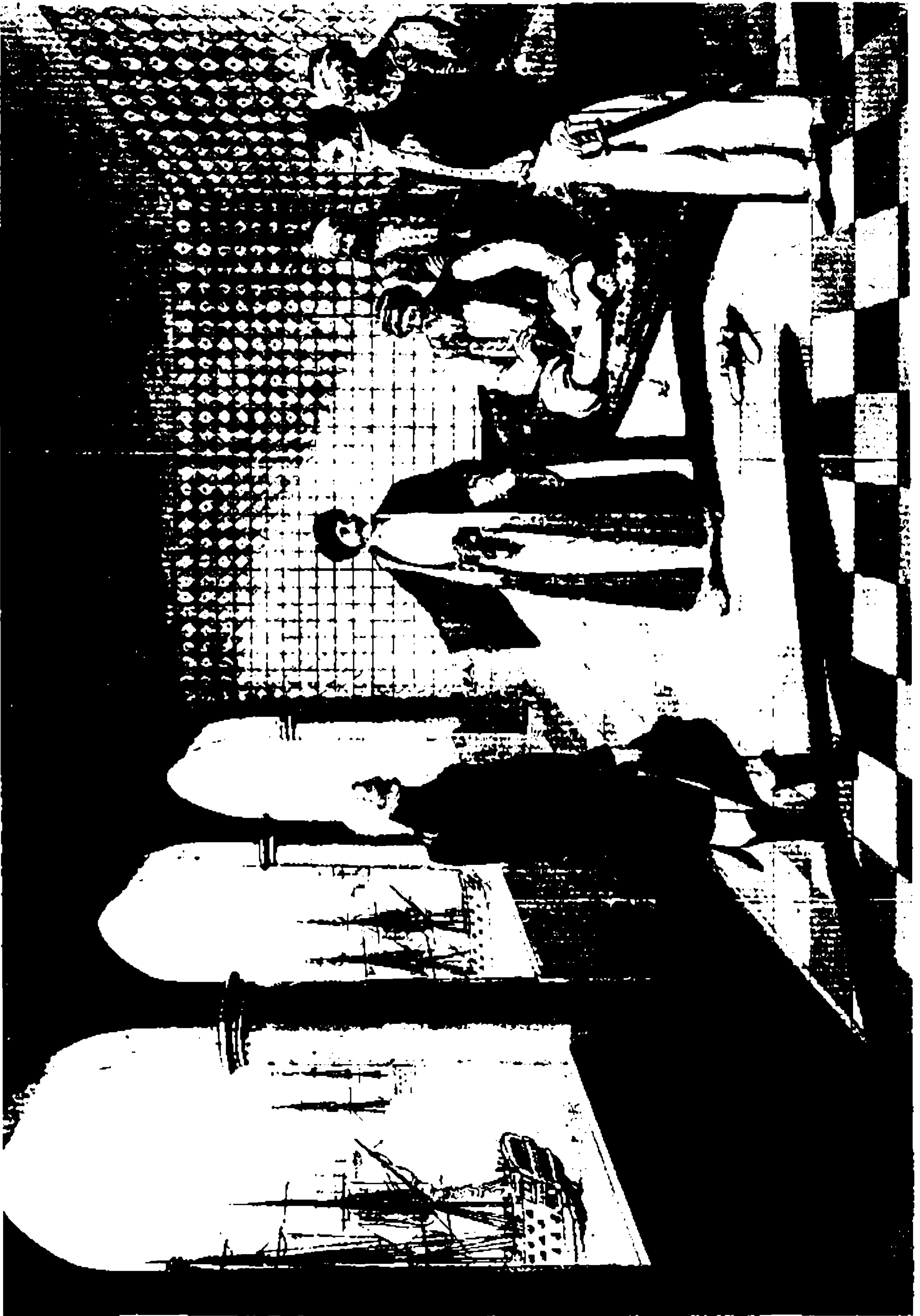
عمر باشا يتفاوض مع رؤساء البحر الانكليز